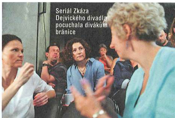
Seriál Zkáza Dejvického divadla počala divákům bránice