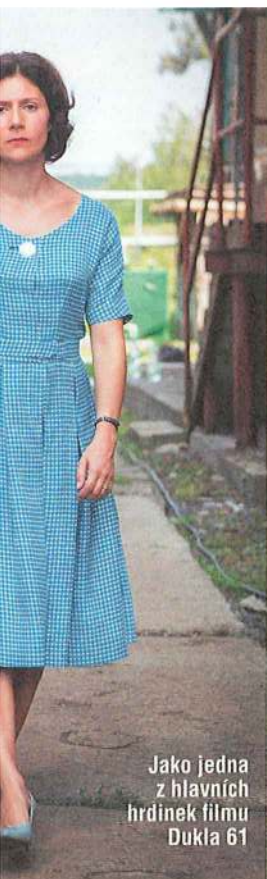
Jako jedna z hlavních hrdinek filmu Dukla 61